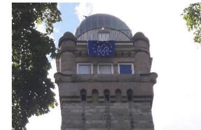
Sternwarte geöffnet zur Besichtigung, zur Sonnenbeobachtung und als Aussichtsturm.

Am Tag wie in der Nacht sehenswert ist auch die spektakuläre Aussicht auf das Bergische Land und das Rheinland von der einzigen Sternwarte in einem Bismarckturm.