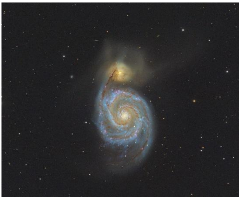
Bild: Spiralgalaxie M 51, genannt Whirlpool-Galaxie, mit Begleitgalaxie NGC 5195 im Sternbild Jagdhunde.

Letzter Stand der Veranstaltungen auf www.sternwarte-remscheid.de unter „Termine“. Die Teilnahme an allen unseren Veranstaltungen geschieht auf eigene Gefahr .