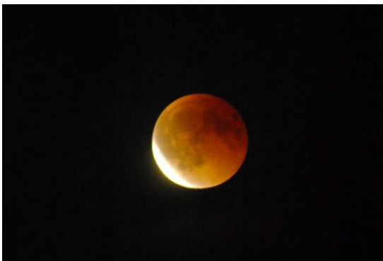
Bild: Totale Mondfinsternis am 07.09.2025 nach Ende der Totalen Phase: Der Mond tritt wieder aus dem Erdschatten heraus.

Letzter Stand der Veranstaltungen auf www.sternwarte-remscheid.de unter „Termine“. Die Teilnahme an allen unseren Veranstaltungen geschieht auf eigene Gefahr .