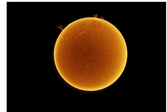
Bild: Sonne, aufgenommen durch ein Spezialfilter-Teleskop (ansonsten darf die Sonne bekanntlich niemals mit optischen Geräten betrachtet werden).

Am Tag wie in der Nacht sehenswert ist auch die spektakuläre Aussicht auf das Bergische Land und das Rheinland von der einzigen Sternwarte in einem Bismarckturm.