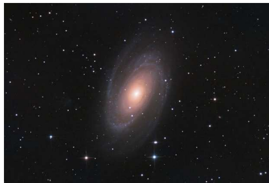
Bild: Spiralgalaxie M81 im Sternbild Großer Bär.