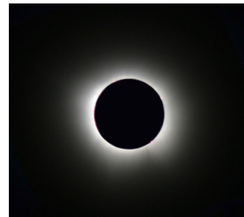
Bild: Totale Sonnenfinsternis in Painesville, Ohio, USA am 08.04.2024.

Donnerstag, 12.12., 18:30 Uhr Restaurant „Marmorino“, Von-Bodelschwingh-Siedlung 1, 42857 Remscheid Einmal im Monat treffen sich Mitglieder des Astronomischen Vereins Remscheid zum gemütlichen Erfahrungsaustausch. Auch Nichtmitglieder sind herzlich willkommen.