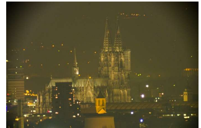
Bild: Kölner Dom, fotografiert 2015 bei Nacht durch den großen Refraktor der Sternwarte Remscheid.