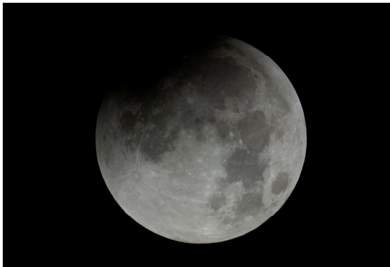
Bild: In etwa vergleichbare partielle Phase der Totalen Mondfinsternis am 28.09.2015.

In einer partiellen Mondfinsternis tritt der Mond nur zum Teil in den Kernschatten der Erde ein. Die maximale Verfinsterung beträgt dieses Mal 12,7 % zur Mitte der Finsternis um 22:14 Uhr.