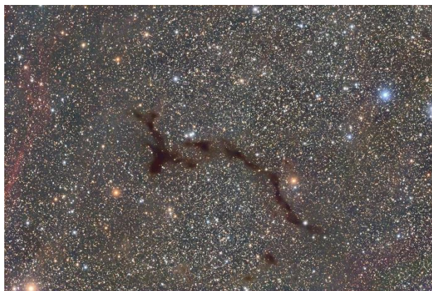
Dunkelnebel Barnard 150 („Seepferdchen“) im Sternbild Cepheus. Interstellare Staubwolken blockieren das dahinterliegende Sternenlicht.