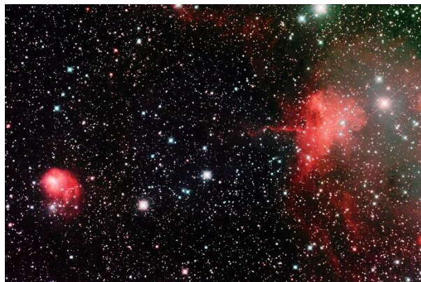
Emissionsnebel NGC 1931 und IC 417 („Spinnennebel“) im Sternbild Fuhrmann.

Restaurant Losenbüchel, Losenbücheler Str. 44, 42857 Remscheid Einmal im Monat treffen sich Mitglieder des Astronomischen Vereins Remscheid zum gemütlichen Erfahrungsaustausch. Auch Nichtmitglieder sind herzlich willkommen.